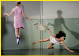
06.10. 19:30 Life in Movement