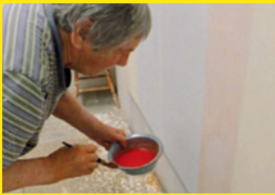
06.10. 18:00 & 07.10. 19:30 Agnes Martin: With My Back to the World