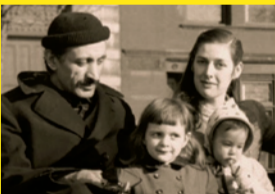
05.10. 20:30 & 07.10. 21:00 Without Gorky