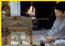
23.09. 21:00 & 30.09. 17:30 Dickens on Film