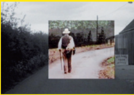
20.09. 20:00 & 03.10. 20:00 Patience (After Sebald)