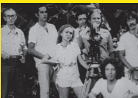
27.09. 20:00 Onde a terra acaba / At the Edge of the Earth