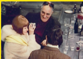
23.09. 17:00 & 04.10. 20:00 L'Ouragan Kalatozov / Hurricane Kalatozov