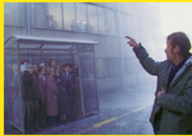
02.10. 20:00 & 07.10. 18:00 Det är en dag imorgon också / Tomorrow's Another Day