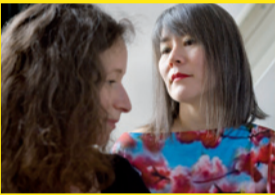
21.09. 19:00 & 25.09. 20:00 Water Children