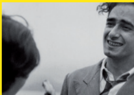
21.09. 21:00 & 26.09. 20:00 Limite / Limit