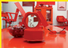
28.09. 19:00 & 12.10. 19:00 Cildo