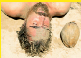
13.10. 21:00 Ex isto / Ex It