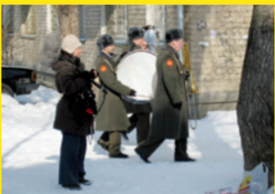
19.09. 20:00 & 22.09. 17:00 Boris Ryzhy