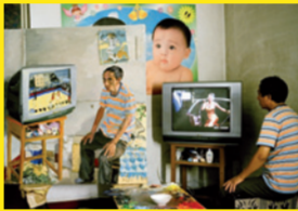
29.09. 19:00 Gin Chen Xiao Ze / Hometown Boy