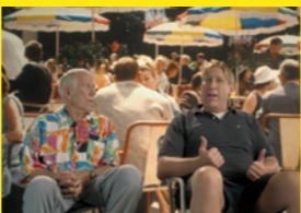
22.09. 21:00 Backstory