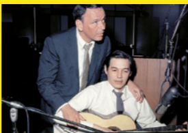
19.09. 22:00 & 28.09. 21:00 A Música Segundo Tom Jobim / The Music According to Antônio Carlos Jobim