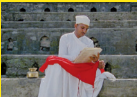
09.10. 20:00 & 13.10. 17:00 Nainsukh